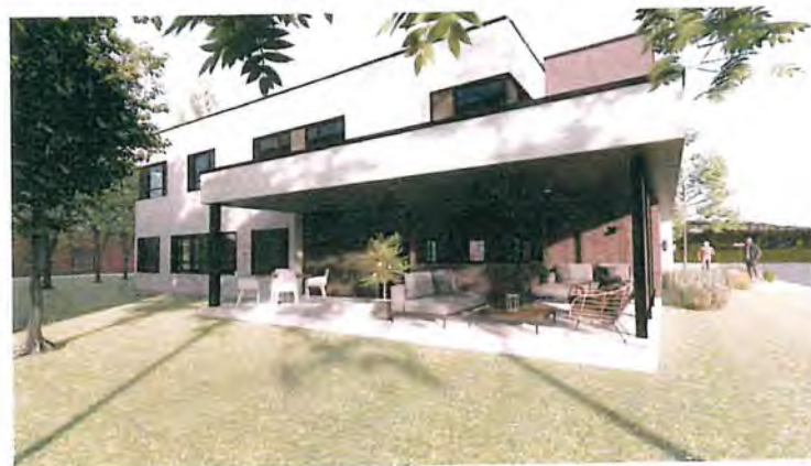
Rue de la Forge