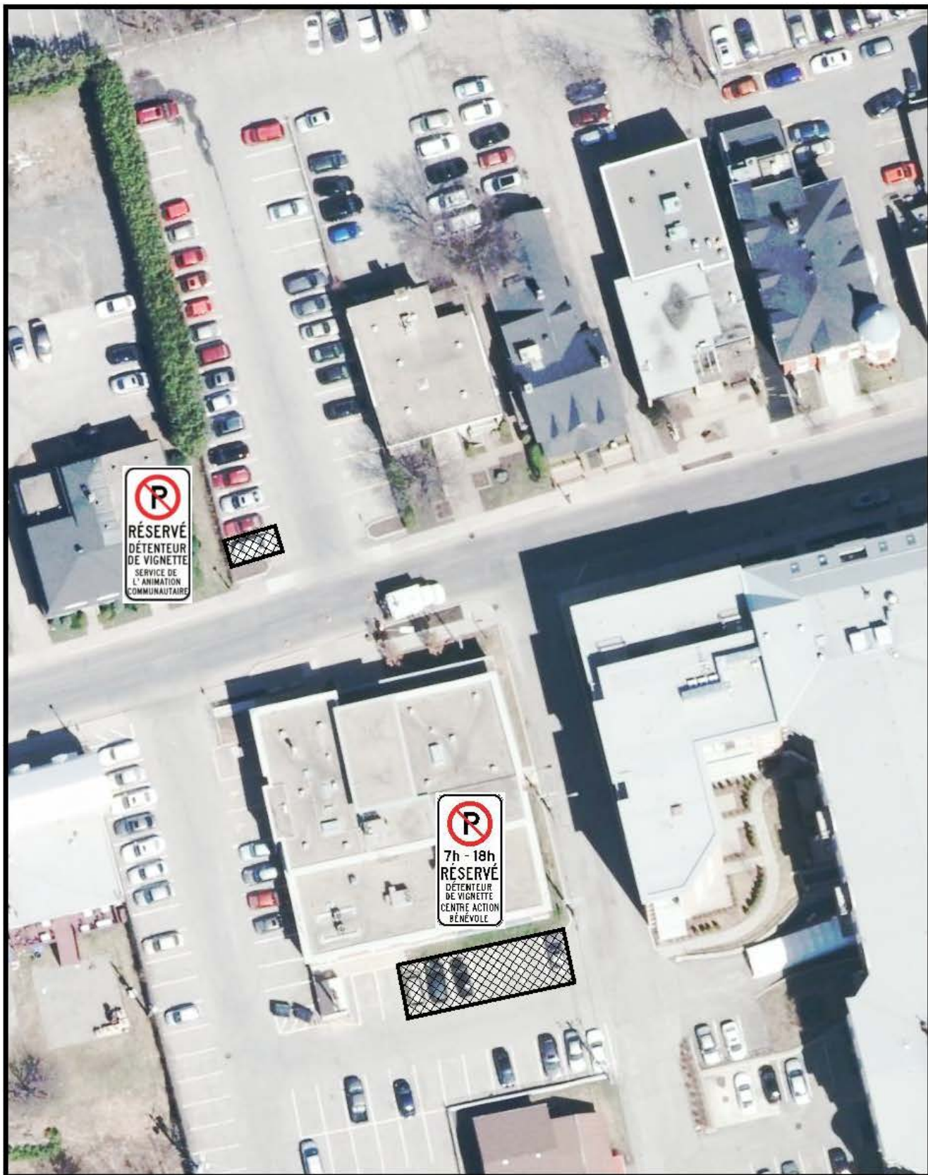
▣ ESPACES DE STATIONNEMENT IDENTIFIÉS (8)